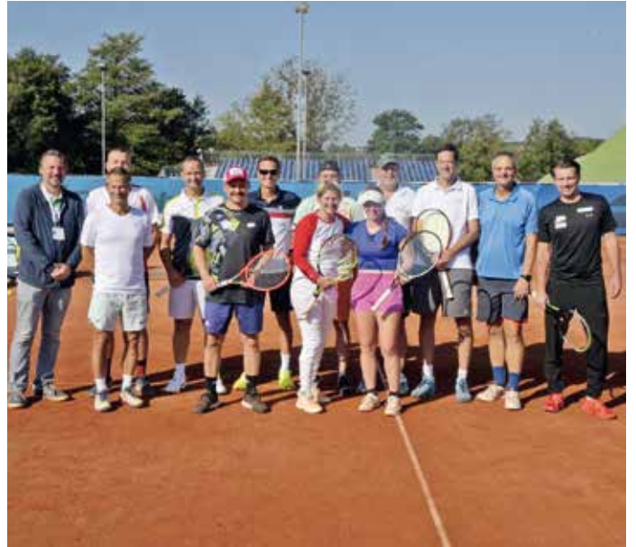
Ein Highlight war das Pro/Am's Tournament powered by Kronen Zeitung.