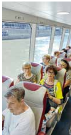
Fahrt mit City-Liner