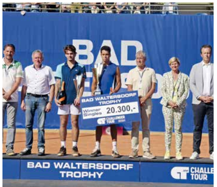
Siegerehrung mit Jaume Munar.