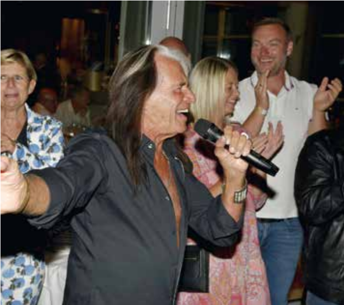
Eröffnungsfeier des Davis Cup im Spielerhotel „Spa Resort Styria“.