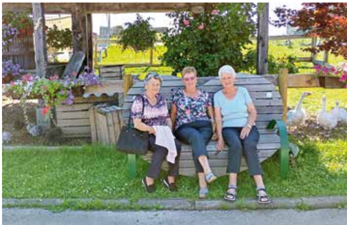
Drei Damen aus Leitersdorf