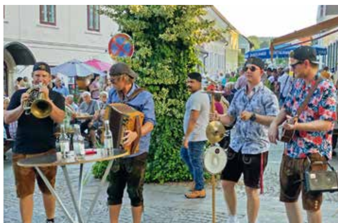
Gasslfest: Die Paradieser Baum