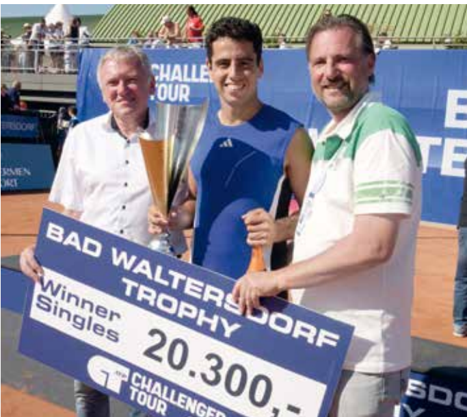
Der Gewinner der ATP Trophy – Jaume Munar.