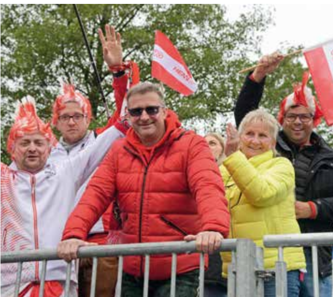
Beste Stimmung beim Davis Cup.