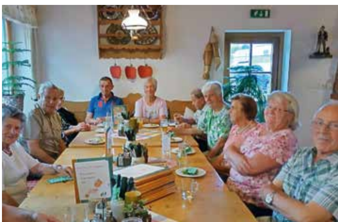
Gemütliche gemeinsame Stunden in der Waldschenke